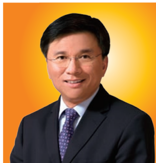
陳家強教授 SBS, JP (左)