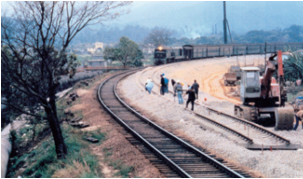
九廣鐵路敷設雙軌工程

於1982年之前，九鐵一直是以政府部門的模式來運作。政府於1982年12月24日通過立法，把九鐵的性質轉為一家公營公司（九廣鐵路公司）。雖然它仍然由政府全資擁有，但法例要求九鐵按審慎的商業原則來營運鐵路。