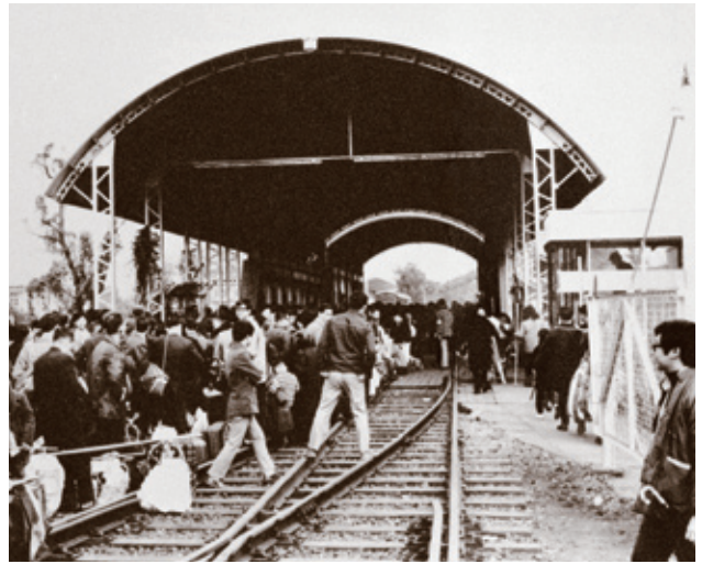
乘客橫過羅湖橋前往內地

在其後60年間，這條單軌鐵路變化緩慢，柴油電動機車從1950年代中期開始逐步取代蒸汽機車。到了1970年代，九廣鐵路出現巨變，除了敷設雙軌，還進行電氣化，從而提供所需運輸能力，以配合沙田、大埔、粉嶺及上水新市鎮因人口迅速膨脹而與日俱增的交通需求。