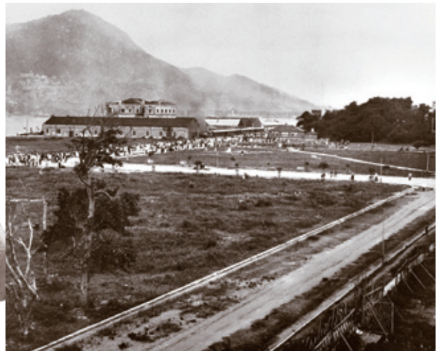
1910年10月1日於尖沙咀開出的首班火車

在一百年前的1910年10月1日，九廣鐵路(英段)開展定期商業鐵路服務。這條由香港政府興建的單軌鐵路，南起九龍尖沙咀，北至粵港邊界的羅湖。一年後，在1911年10月5日，內地當局為廣九鐵路(華段)舉行通車，將路線從羅湖延伸至廣州。