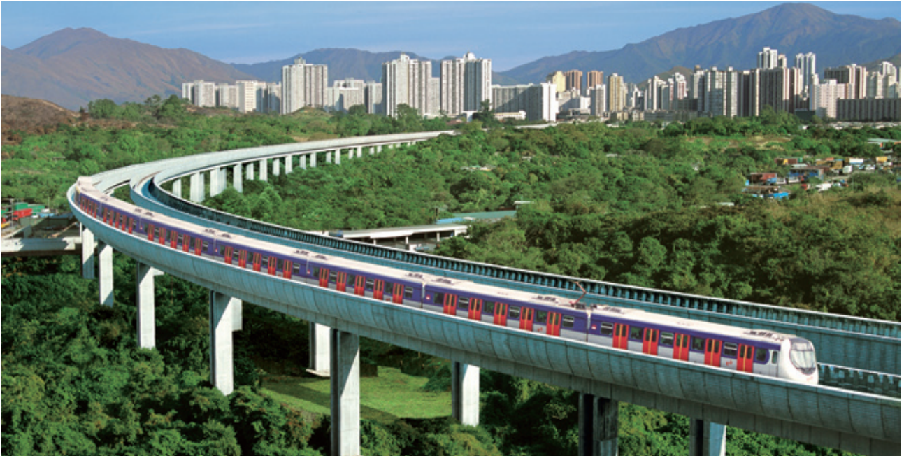
高架路上連接南昌及屯門的西鐵列車

位於西九龍的中途站(柯士甸站)。該項工程包括興建一條行人隧道以連接中間道行人隧道，使九鐵尖東站的行人隧道網和北京道及九龍公園徑的行人隧道連接起來，為該區作為商業和旅遊區提供更好的一體化行人設施。