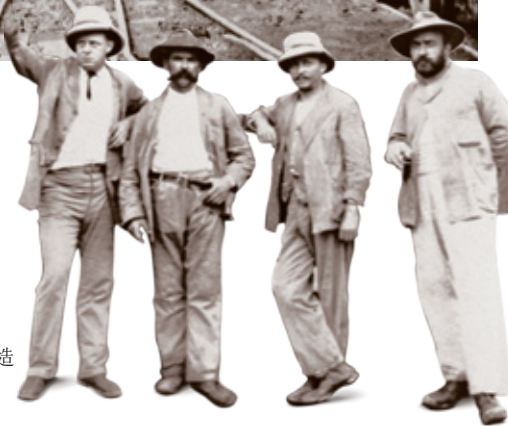
1907年的英籍建造員工

在一百年前的1910年10月1日，九廣鐵路(英段)開展定期商業鐵路服務。這條由香港政府興建的單軌鐵路，南起九龍尖沙咀，北至粵港邊界的羅湖。一年後，在1911年10月5日，內地當局為廣九鐵路(華段)舉行通車，將路線從羅湖延伸至廣州。