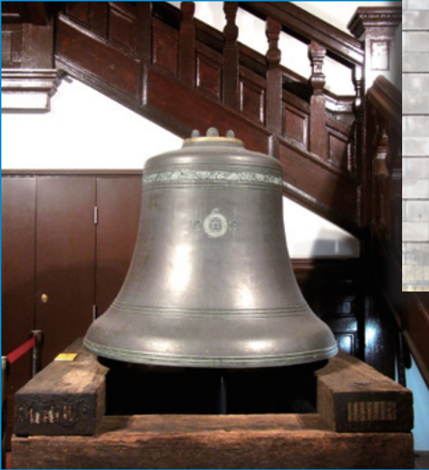
鐵路枕木上的銅鐘，現位於尖沙咀鐘樓內。