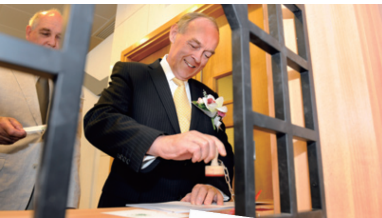
九鐵總裁詹伯樂先生在鐵路百年展覽開幕禮中為紀念明信片蓋章

對公司而言，2010年是不平凡的一年。距今100年前，九廣鐵路通車，沿著今天稱為東鐵綫的單軌鐵路，提供往來尖沙咀與羅湖的定期服務。為慶祝通車百周年，公司在前九鐵員工、香港鐵路有限公司、鐵路文物個人收藏者與政府各政策局及部門的幫助下，舉辦了兩項紀念活動，並支持香港郵政於2010年9月發行一套鐵路百年紀念郵票。