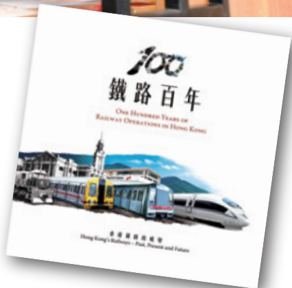
鐵路百年展覽的雙語紀念小冊子

公司亦主動將九鐵銅鐘送還香港市民。九鐵銅鐘重一噸，最初於1921年懸掛在尖沙咀前九鐵總站鐘樓內。10月9日至11月8日，鐵路百年展覽在沙田香港文化博物館舉行，以各種照片及展品展示了香港鐵路百年來的發展歷程。