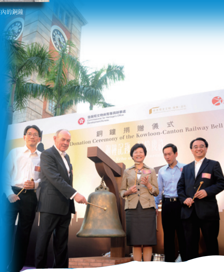
九鐵銅鐘捐贈儀式

2010年，作為鐵路通車百周年慶祝活動的一部分，九鐵與古物古蹟辦事處作出安排，將銅鐘回贈予香港