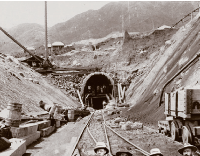
1909年興建中的筆架山隧道