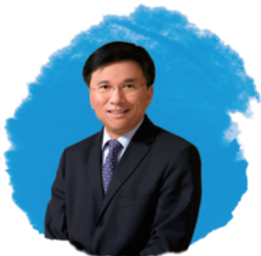
陳家強教授 SBS, JP(左)