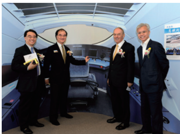
主禮嘉賓留影，背景為高速鐵路列車駕駛室的圖片。

運輸及房屋局副局長邱誠武先生於10月9日主持展覽開幕禮。在接下來的一個月，約有18,000名海內外人士參觀了展覽。從參觀者的留言及口頭意見來看，這次展覽活動深受歡迎。