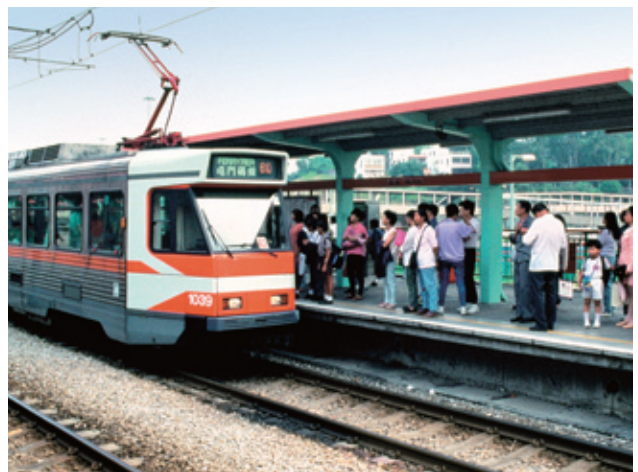
服務新界西北的輕鐵

2006年8月，九鐵展開九龍南線工程。這條新線於2009年8月通車，把東鐵和西鐵連接起來。延線全長3.8公里，連接起西鐵的南昌站和尖東站，中間有一個